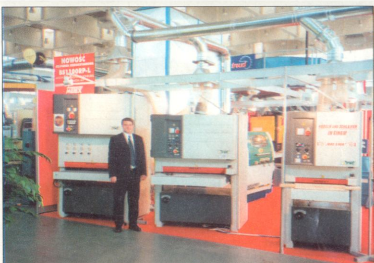
Expozice firmy RWT - DREMA 2002