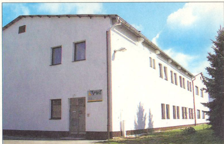
Hala firmy RWT v Rychnově

Na letošním Mezinárodním salónu strojů a nářadí na obrábění dřeva DREMA v Poznani získaly zlatou medaili stroje v dalších kategoriích těchto pěti firem: